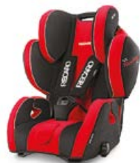
Limited Racing Edition 6203.21414.66