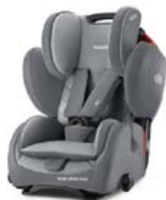
Aluminium Grey 6203.21503.66