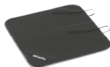
Ochraniacz na fotel 3400.20900.00