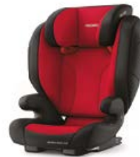
Racing Red Monza Nova Evo 6158.21509.66 Monza Nova Evo Seatfix 6159.21509.66