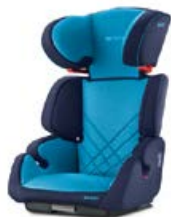
Xenon Blue 6207.21504.66 6209.21504.66 Seatfix