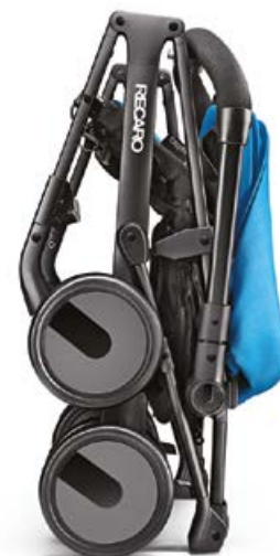
Niewielkie rozmiary po złożeniu