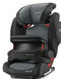
Dodatkowa tapicerka Carbon Black 96150B21502