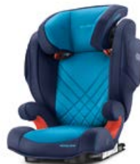
Xenon Blue 6150.21504.66 6151.21504.66 Seatfix