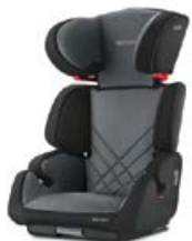
Carbon Black 6207.21502.66 6209.21502.66 Seatfix