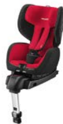
Racing Red 6137.21509.66