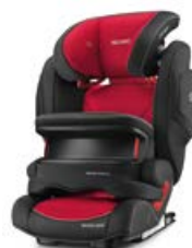
Racing Red 6148.21509.66