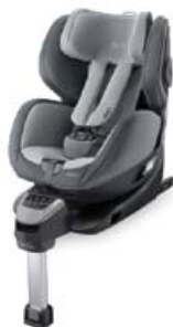
Aluminium Grey 6300.21503.66