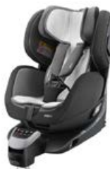
Wkładka letnia 96136B21601