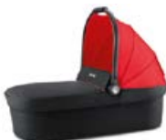
Gondola Ruby 5653.21361.66