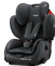
Performance Black 6203.21534.66