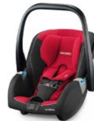
Racing Red 5516.21509.66