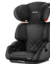
Performance Black 6207.21534.66 6209.21534.66 Seatfix