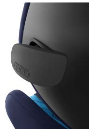
Rozkładane osłony boczne Advanced Side Protection (ASP)