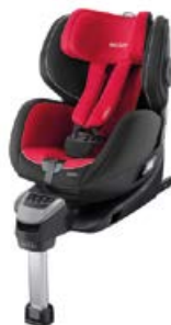
Racing Red 6300.21509.66