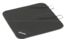
Ochroniacz na fotel 3400.20900.00