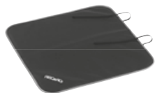
Ochroniacz na fotel 3400.20900.00