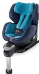
Xenon Blue 6300.21504.66