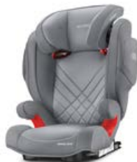
Aluminium Grey 6150.21503.66 6151.21503.66 Seatfix