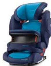
Xenon Blue 6148.21504.66