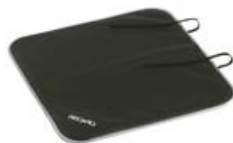
Ochraniacz na fotel 3400.20900.00