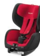
Dodatkowa tapicerka Racing Red 96137B21509