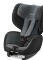
Dodatkowa tapicerka Carbon Black 96137B21502