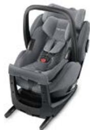
Aluminium Grey 6301.21503.66