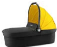
Gondola Sunshine 5653.21360.66