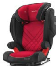
Racing Red 6150.21509.66 6151.21509.66 Seatfix