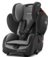
Carbon Black 6203.21502.66