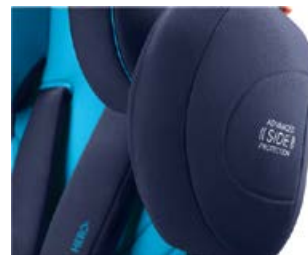
Advanced Side Protection