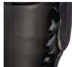
System obiegu powietrza RECARO (ACS)