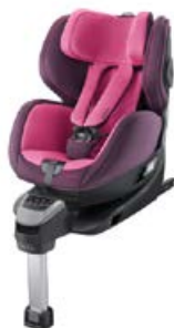
Power Berry 6300.21508.66