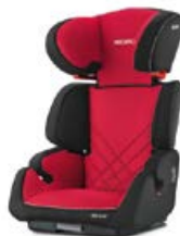
Dodatkowa tapicerka Racing Red 96207B21509