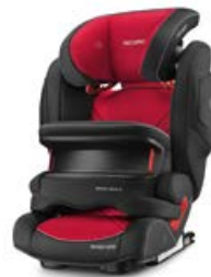
Dodatkowa tapicerka Racing Red 96150B21509