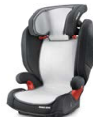
Wkładka letnia Air Mesh 96150B21601