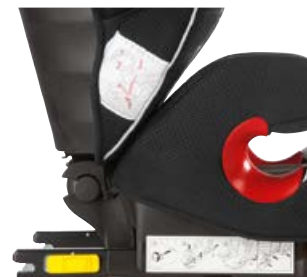
Dostępny z mocowaniami SEATFIX