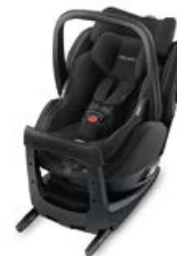
Performance Black 6301.21534.66