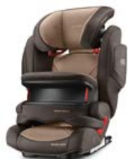
Dakar Sand 6148.21506.66