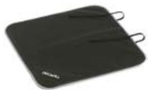
Ochraniacz na fotel 3400.20900.00