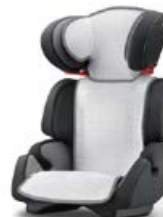
Wkładka letnia Air Mesh 96150B21601