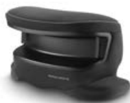
Dodatkowa tapicerka osłony uderzeniowej Carbon Black 96148B21502 Racing Red 96148B21509