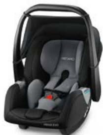
Carbon Black 5517.21502.66