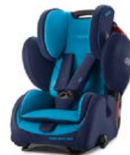
Xenon Blue 6203.21504.66