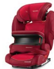
Indy Red 6148.21505.66