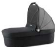
Gondola Graphite 5653.21208.66