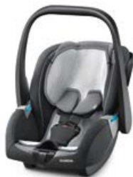
Wkładka letnia 95516B21601