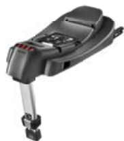
Baza RECARO SmartClick 5004.000.66