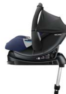
RECARO Privia Evo na bazie RECARO SmartClick