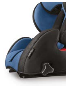
Łatwa regulacja pozycji spoczynkowej