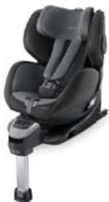
Carbon Black 6300.21502.66