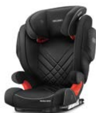
Performance Black 6150.21534.66 6151.21534.66 Seatfix