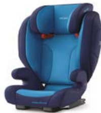
Xenon Blue Monza Nova Evo 6158.21504.66 Monza Nova Evo Seatfix 6159.21504.66