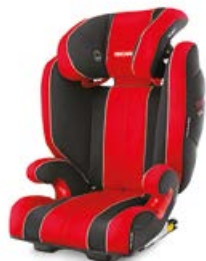
Limited Racing Edition 6151.212414.66