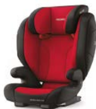
Dodatkowa tapicerka Racing Red 96158B21509