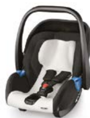
Tapicerka letnia 95515B21404