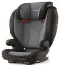
Carbon Black Monza Nova Evo 6158.21502.66 Monza Nova Evo Seatfix 6159.21502.66