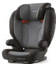
Dodatkowa tapicerka Carbon Black 96158B21502