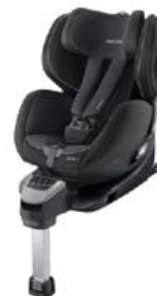
Performance Black 6300.21534.66