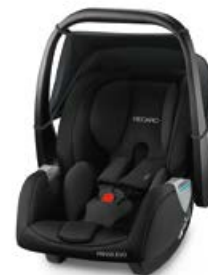
Performance Black 5517.21534.66