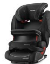
Performance Black 6148.21534.66