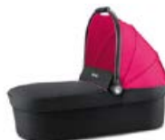
Gondola Pink 5653.21211.66