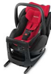
Racing Red 6301.21509.66