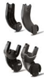
Adaptory do fotelika Privia 5654.010.00 Young Profi plus 5654.020.00