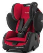
Racing Red 6203.21509.66