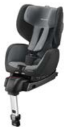
Carbon Black 6137.21502.66