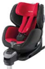
Dodatkowa tapicerka Racing Red 96300B21509