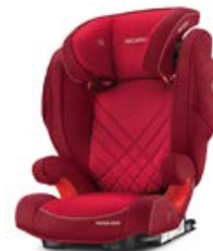
Indy Red 6150.21505.66 6151.21505.66 Seatfix