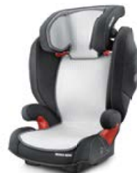
Tapicerka letnia 96146B21205