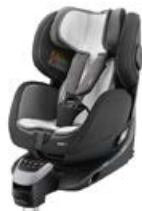
Wkładka letnia 96136B21601