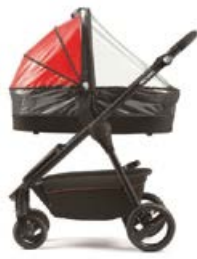
Ostona przeciwdeszczowa do gondoli 5655.000.00