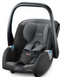
Carbon Black 5516.21502.66