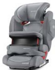
Aluminium Grey 6148.21503.66