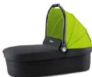
Gondola Lime 5653.21362.66