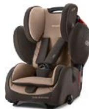
Dakar Sand 6203.21506.66