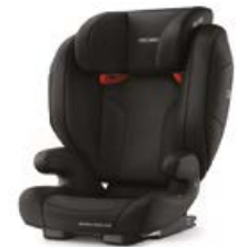
Performance Black Monza Nova Evo 6158.21534.66 Monza Nova Evo Seatfix 6159.21534.66