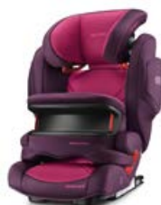
Power Berry 6148.21508.66