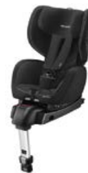
Performance Black 6137.21534.66