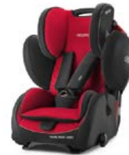
Dodatkowa tapicerka Racing Red 96203B21509