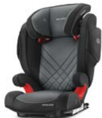
Carbon Black 6150.21502.66 6151.21502.66 Seatfix