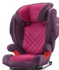
Power Berry 6150.21508.66 6151.21508.66 Seatfix