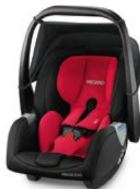
Racing Red 5517.21509.66