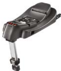
Baza RECARO SmartClick 5004.000.66