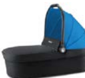
Gondola Saphir 5653.21212.66