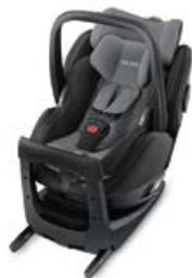
Carbon Black 6301.21502.66