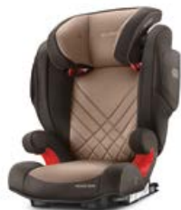
Dakar Sand 6150.21506.66 6151.21506.66 Seatfix