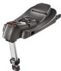
Baza RECARO SmartClick 5004.000.66