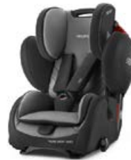
Dodatkowa tapicerka Carbon Black 96203B21502