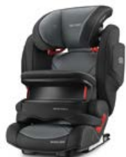
Carbon Black 6148.21502.66