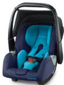
Xenon Blue 5517.21504.66