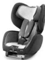
Wkładka letnia Air Mesh 96136B21601