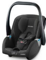
Performance Black 5516.21504.66