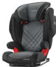
Dodatkowa tapicerka Performance Black