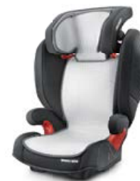
Wkładka letnia Air Mesh 96150B21601