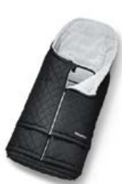
Śpiworek z regulacją długości