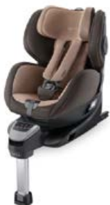
Dakar Sand 6300.21506.66