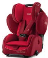
Indy Red 6203.21505.66