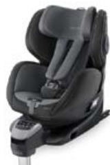
Dodatkowa tapicerka Carbon Black 96300B21502