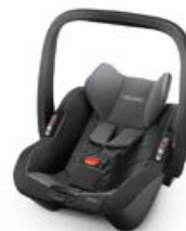
Dodatkowa tapicerka nosidełka Carbon Black 96301B21502