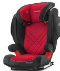
Dodatkowa tapicerka Performance Black