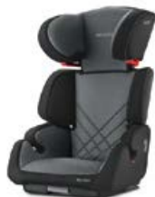
Dodatkowa tapicerka Carbon Black 96207B21502