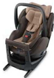
Dackar Sand 6301.21506.66