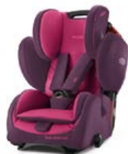
Power Berry 6203.21508.66