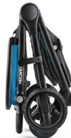
Niewielkie rozmiary po złożeniu.