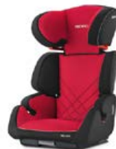
Racing Red 6207.21509.66 6209.21509.66 Seatfix