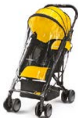
Oślona przeciwdeszczowa 5604.000.00