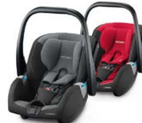
Dodatkowa tapicerka Carbon Black 95516B21502 Racing Red 95516B21509