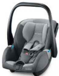
Aluminium Grey 5516.21503.66