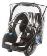
Oslona przeciwdeszczowa 3816.000.00