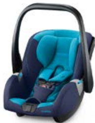
Xenon Blue 5516.21504.66