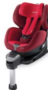
Indy Red 6300.21505.66