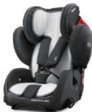
Wkładka letnia 96203B21601