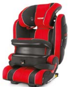
Limited Racing Edition 6148.21414.66