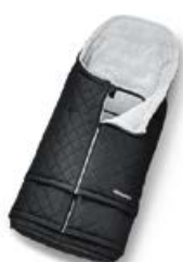
Śpiworek z regulacją długości