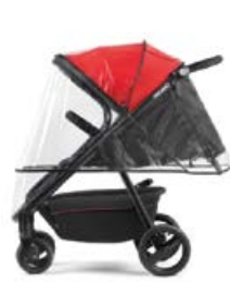
Ostona przeciwdeszczowa do siedziska spacerowego 5654.000.00