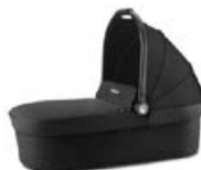
Gondola Black 5653.21501.66