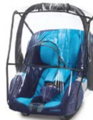
Osłona przeciwdeszczowa 3816.000.00