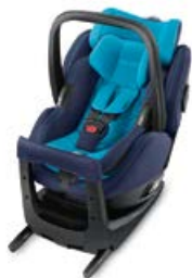
Xenon Blue 6301.21504.66