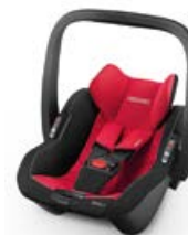
Dodatkowa tapicerka nosidełka Racing Red 96301B21509